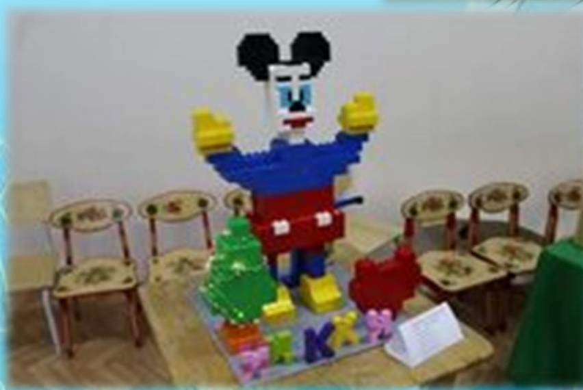
«Моя любимая игрушка»